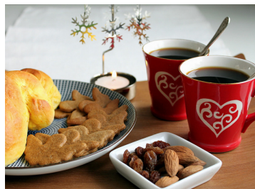
Tack till Er som deltog på luciafikat

Vi har införskaffat nya taggar till garagen, de gamla kommer att sluta fungera till årsskiftet. Det finns även möjlighet att erhålla 1 extra tagg mot en kostnad av 200:-/tagg 200:- /tagg gäller även om Ni skulle tappa Er tagg och behov av ny finns.